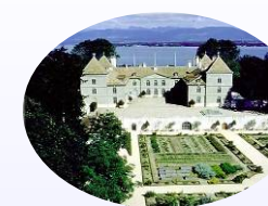
Château de Prangins