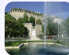
La Place Neuve